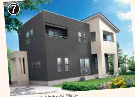
個性的な外観と全室南向きのあつたかマイホーム。