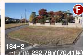
134-2 土地面積 232.78㎡(70.41坪)