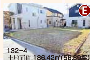
132-4 土地面積 186.42㎡(56.36坪)