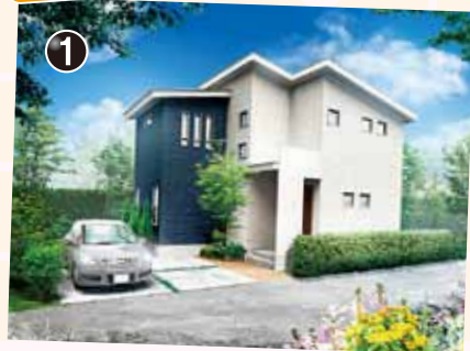
コンパクトな生活空間に充実した設備をプラス。