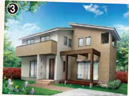
ウッドデッキと広々バルコニー暮らしを楽しむ人の住まい。