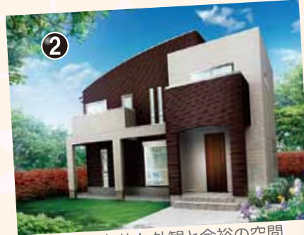
印象的な外観と余裕の空間ゆとりの暮らしを実現。