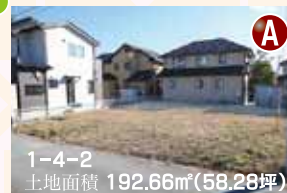
1-4-2 土地面積 192.66㎡(58.28坪)