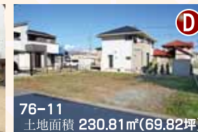
76-11 土地面積 230.81㎡(69.82坪)