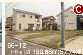
66-12 土地面積 190.88㎡(57.74坪)