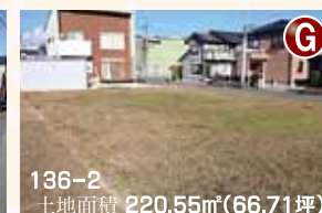
136-2 土地面積 220.55㎡(66.71坪)