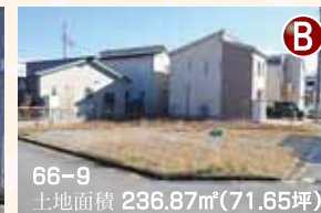
66-9 土地面積 236.87㎡(71.65坪)