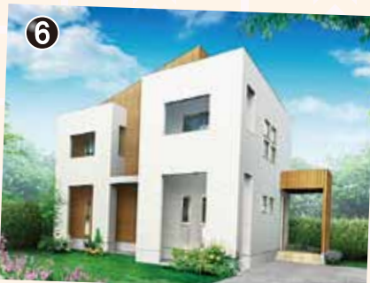
全室南向き お子様の成長に合わせて区切れる2階寝室。