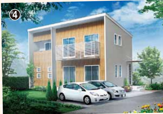
スタイリッシュな外観にこだわり、さらに暮らしやすさを追求。