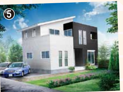
採光・通風のよい2階リビング最高のくつろぎプラン。